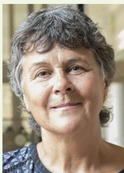
Dominique Voynet Inspectrice Générale des Affaires Sociales