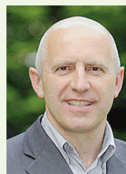
Dominique Potier Député

Vendredi 15 juin 2018 à 18 h salle multi-activités PONT SAINT VINCENT