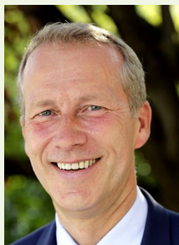
Guillaume Garot Député, Président du Conseil National de l'Alimentation