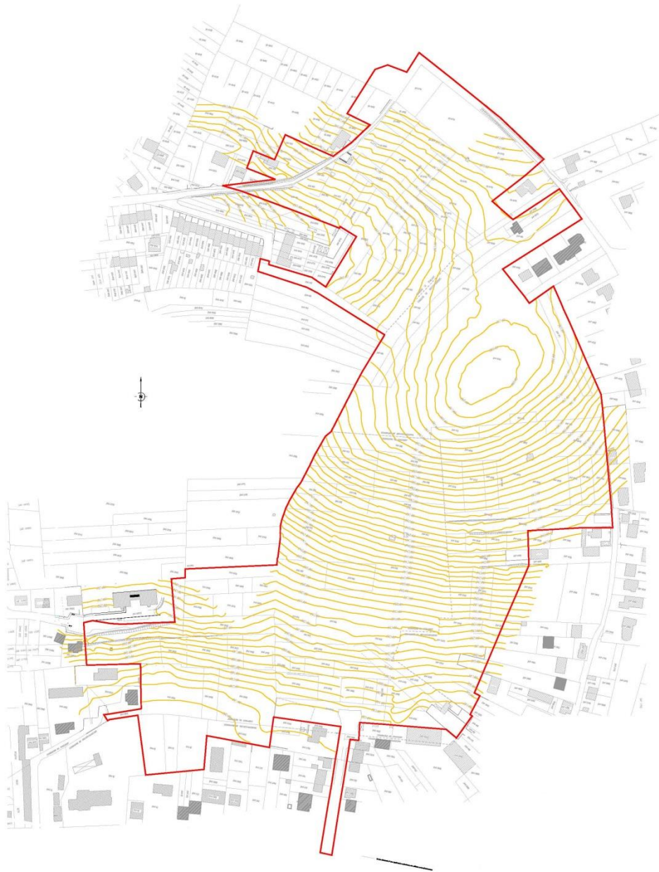
Périmètre de ZAC envisagé